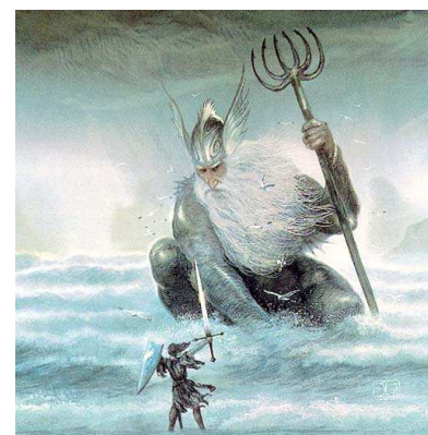
Sopra: © John Howe, Ulmo and Tuor da sinistra: Nettuno e Uinen.

parlare dell'umore incostante o, peggio ancora, quando le tempeste sono scatenate volontariamente; ecco così che arriviamo al lato "oscuro" del mare, l'acqua come portatrice di morte; le navi che salpavano verso l'Occidente contro la volontà dei Valar potevano avere due diversi destini: o affondate o scaraventate contro le scogliere. Quella stessa acqua che ti dona la vita, se la riprende... possiamo dire che il cerchio è infine chiuso.