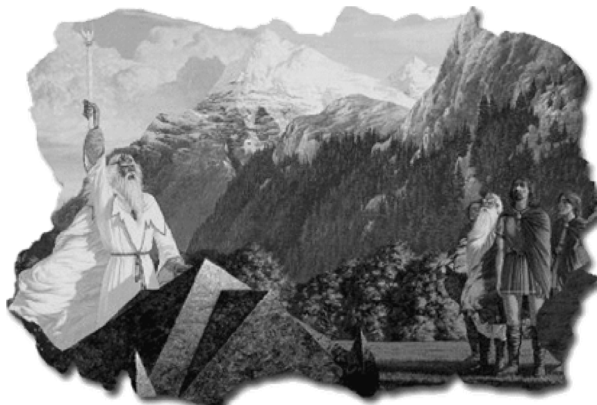
Sotto: ©Endore, n1 Primavera 1999.