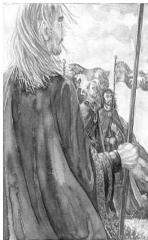
Sopra: ©Anke Eissmann, EORL.

(= essere) ed il pronome "i" (= che) da cui si ottiene nâ + i = nai (= sia che, posto che). E' utilizzato per la costruzione del condizionale. Tiruvantes (= lo vigileranno) è un verbo coniugato al futuro nella terza persona plurale. E' formato da tirava (= guarderà, vigilerà) + -nte (= suffisso per la 3° persona plur.) + -s (= pronome accusativo della 3° persona sing). Preceduto da nai significa "possano vigilarlo" o "che essi lo vigilino". Mahalmassen (= sui troni) locativo plurale di Mahalma. Tennoio (= per sempre) è formato da tenna (= sinché, fino a che) + oio (=sempre).